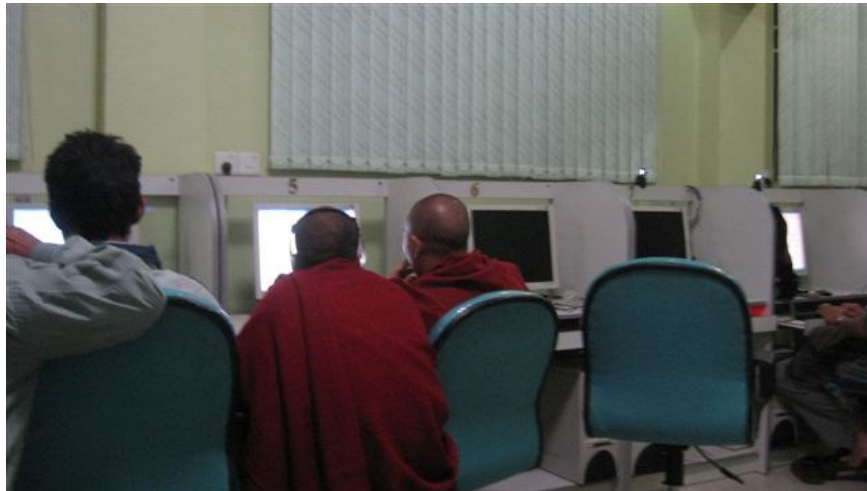
Internet point a Mandalay, gennaio 2009

La giunta militare che governa il paese l'ha imposto come gesto anticoloniale.